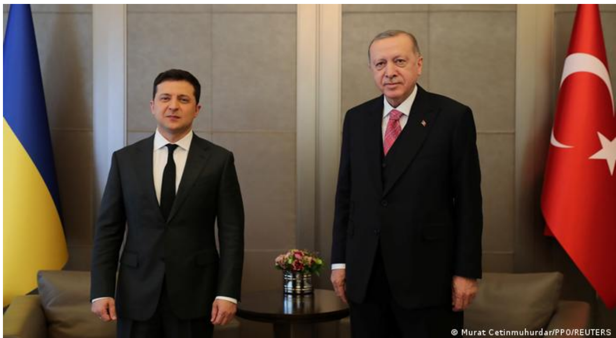
თურქეთისა და უკრაინის პრეზიდენტების შეხვედრა სტამბოლში 2021 წლის 10 აპრილს

ზემოაღნიშნულს დაემატა ისიც, რომ რუსეთ-უკრაინის კრიზისის ზენიტში, 2021 წლის 10 აპრილს, თურქეთს ოფიციალური ვიზიტით ეწვია უკრაინის პრეზიდენტი ვოლოდიმირ ზელენსკი და მოლაპარაკებები გამართა თურქ კოლეგასთან რეჯეფ თაიფ ერდოღანთან. 12