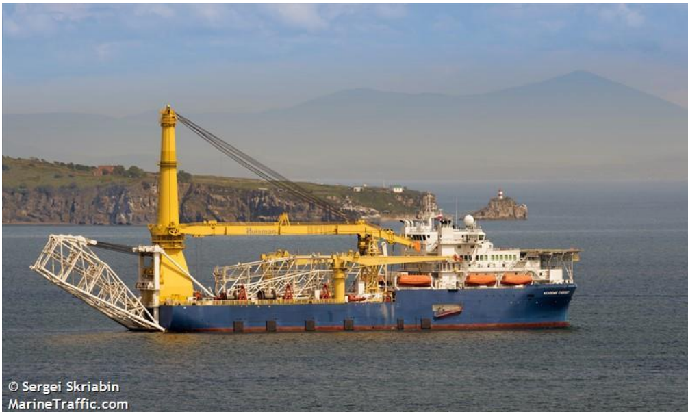
მილსადენების მშენებელი რუსული გემი - „აკადემიკ ჩერსკი“.

მთავარი მოვლენა: რუსული მედიის ცნობით, გემმა „აკადემიკ ჩერსკიმ“ ბალტიის ზღვაში ღუზა ჩაუშვა. ამერიკული სანქციების პირობებში გემმა რუსეთ-გერმანიის დამაკავშირებელი მილსადენის პროექტის – „ჩრდილოეთის ნაკადი-2-ის“ დასრულება უნდა უზრუნველყოს.