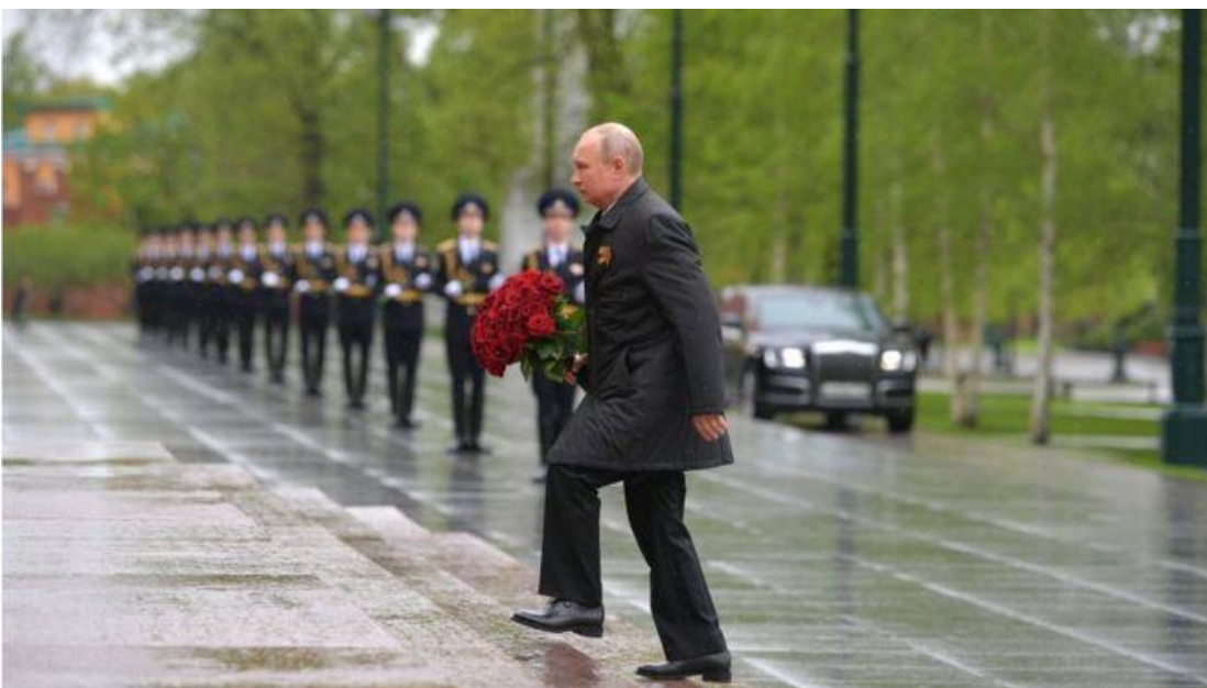
ვლადიმერ პუტინი „9 მაისის“ ღონისძიებაზე.

ლუკაშენკოსგან განსხვავებით, რუსეთის პრეზიდენტმა ვლადიმერ პუტინმა მარტომ მიაგო პატივი ალექსანდროვსკის პარკში უცნობი ჯარისკაცის საფლავს და მოსახლეობას მიმართა. ეს იყო 32-დღიანი თვითიზოლაციიდან პუტინის პირველი გამოსვლა. პუტინის გამოსვლის დასრულების შემდეგ ფედერალურმა ტელეარხებმა წითელი მოედნიდან ავიააღლუმი აჩვენეს, რომელიც 5 წუთი გაგრძელდა.