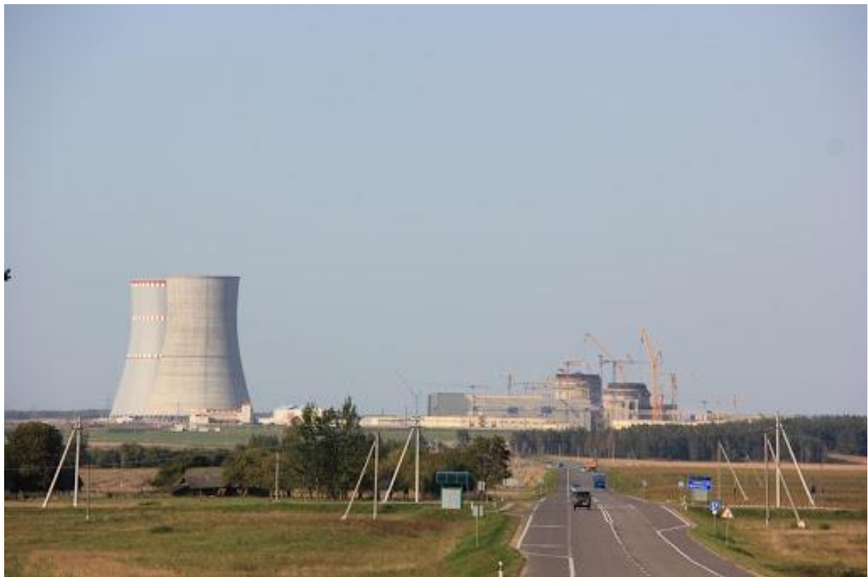
მშენებარე ატომური ელექტროსადგური.

მოვლენა დეტალურად: ეს იქნება პირველი ატომური ელექტროსადგური, რომელიც ბელარუსში გროდნენის ოლქში აშენდება. ორი რეაქტორის ჯამური სიმძლავრე 2400 მეგავატი იქნება. სადგურს რუსეთის სახელმწიფო კორპორაცია „როსატომის“ შვილობილი კომპანია „ატომსტროიექსპორტი“ აშენებს. მშენებლობა 2011 წელს დაიწყო. სადგურის პირველი ბლოკის ექსპლუატაციაში გაშვება ივლისში იგეგმება, მეორის – 2021 წელს. მშენებლობისთვის საჭირო 10 მლრდ აშშ დოლარის კრედიტი ბელარუსმა რუსეთისგან მიიღო.