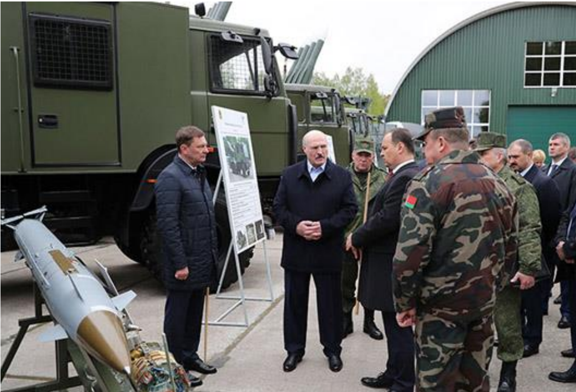
ალექსანდრე ლუკაშენკო რაკეტას ათვალიერებს.

ლუკაშენკომ უცხოელ პარტნიორებზე დამოკიდებულების შემცირების მიზნით ადრე 300 კმ სიშორის საკუთარი წარმოების რაკეტების დამზადება მოითხოვა. რაკეტების დამზადების საბოლოო თარიღად სექტემბერი სახელდება. რუსეთის უარის შემდეგ რაკეტების გამოსაცდელ სავარაუდო პოლიგონებად განიხილება ჩინეთის, ყაზახეთის, უზბეკეთისა და საუდის არაბეთის ვარიანტები.