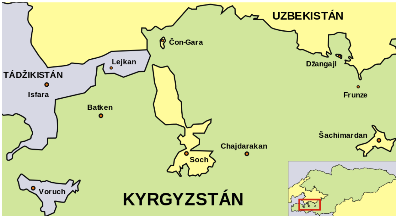
ანკლავები ცენტრალურ აზიაში.

ორ ქვეყანას შორის სასაზღვრო კონფლიქტი საბჭოთა კავშირის დაშლის შემდეგ გახშირდა. შეუთანხმებელი სასაზღვრო მონაკვეთების გამო ხშირია დაპირისპირებები, რაც მსხვერპლითაც სრულდება.