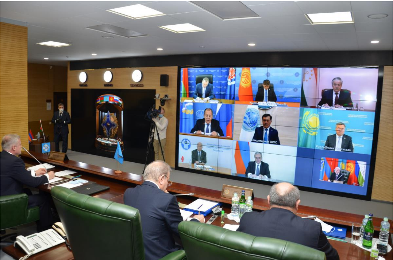
კუხოს წევრი ქვეყნების საგარეო საქმეთა მინისტრების ვიდეოკონფერენცია.

მოვლენა დეტალურად: კუხოს წევრები არიან რუსეთი და პოსტსაბჭოთა სივრცეში მოსკოვის ყველაზე ახლო მოკავშირეები: ბელარუსი, სომხეთი, ყაზახეთი, ყირგიზეთი, ტაჯიკეთი. ერთი სამხედრო ორგანიზაციის წევრობის მიუხედავად, ბოლო პერიოდში ქვეყნებს შორის სხვადასხვა საკითხის გამო დაპირისპირებები გახშირდა. მაგ., 24 მაისს ტაჯიკეთ-ყირგიზეთს შორის ერთ-ერთი ანკლავის ირგვლივ სიტუაცია ისე დაიძაბა, რომ მესაზღვრეებმა ერთმანეთს ცეცხლი გაუხსნეს; ბელარუსს 2020 წლიდან ნავთობისა და გაზის ფასის გამო რუსეთთან ურთიერთობა გაურთულდა; სომხეთი კი ბოლო პერიოდში სამხედრო სფეროში რუსეთის აზერბაიჯანთან თანამშრომლობას ეჭვის თვალით უყურებს.