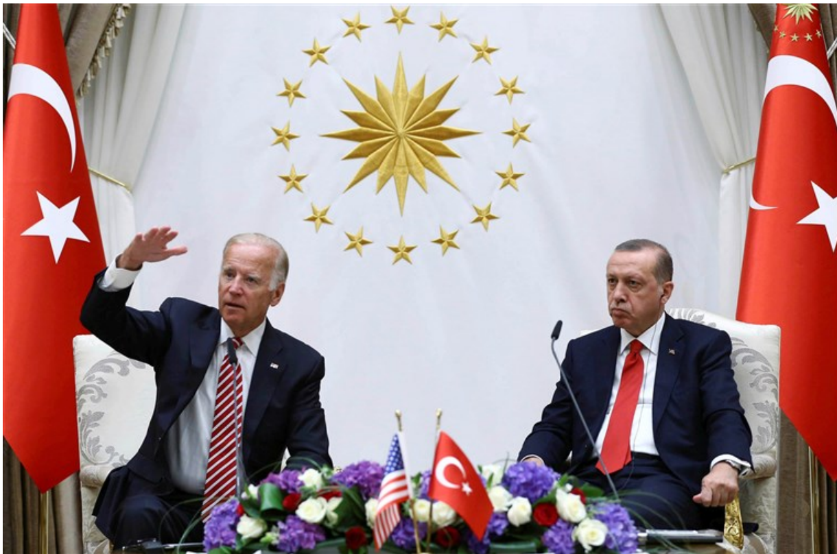
ერდოღან-ბაიდენის შეხვედრა ანკარაში, 2016 წლის 24 აგვისტო

2019 წლის 11 ივლისს ნიუ-იორკის უნივერსიტეტში სიტყვით გამოსვლისას ბაიდენმა პირობა დადო, რომ მისი პრეზიდენტად არჩევის შემთხვევაში, იგი „აღადგენს ტრამპამდე არსებულ მსოფლიო წესრიგს“. მან იქვე ხაზი გაუსვა, რომ მისი აზრით, სამინაო და საგარეო პოლიტიკა ერთმანეთის შემადგენელი ნაწილებია.