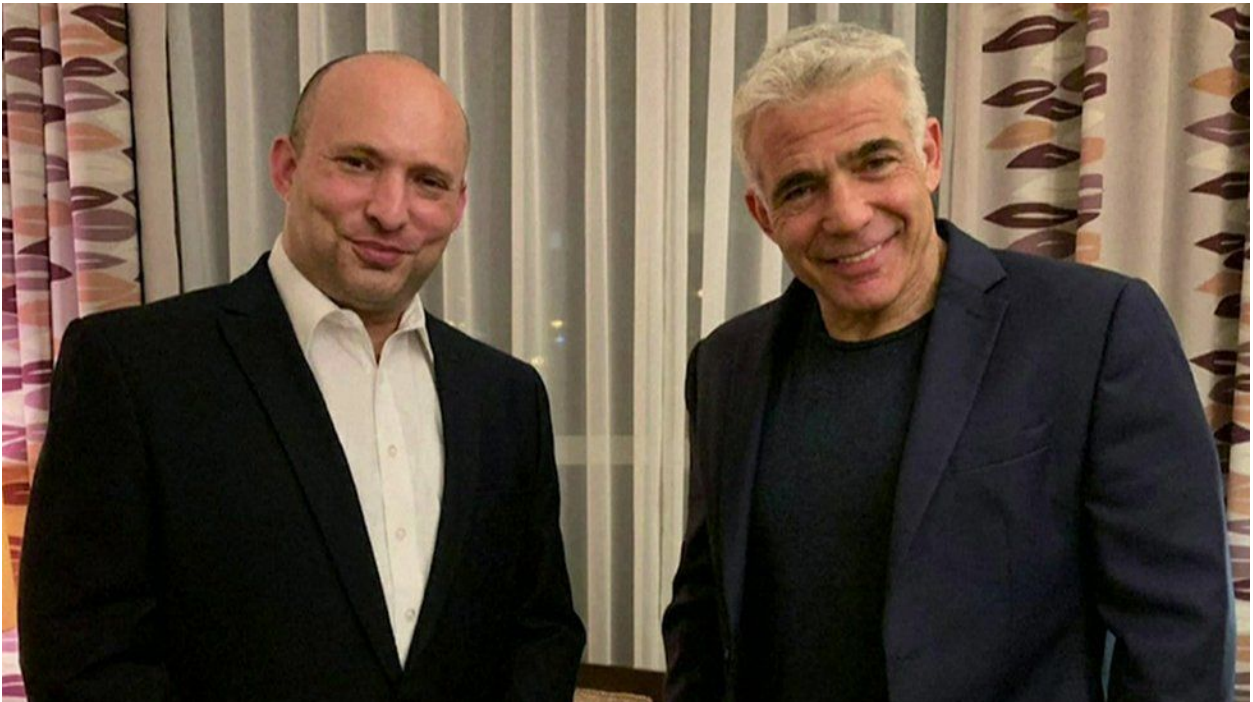
ნაფტალი ბენეტი და იაირ ლაპიდი

პარტიებს შორის მიღწეული შეთანხმების მიხედვით, თავდაპირველად მთავრობის მეთაური მემარჯვენე პარტია „იამინას“ ლიდერი ნაფტალი ბენეტი გახდება, ორი წლის შემდეგ კი მის ადგილს კოალიციის ყველაზე დიდი წევრის ცენტრისტული „მომავლის პარტიის“ ლიდერი იაირ ლაპიდი დაიკავებს.