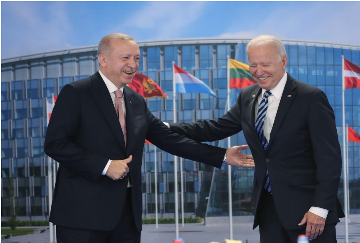
ბაიდენ-ერდოღანის შეხვედრა ბრიუსელში

პრეზიდენტებს შორის გამართული მოლაპარაკებების შემდეგ გავრცელებული ინფორმაციის მიხედვით, შეხვედრა საათ-ნახევარი გრძელდებოდა (ამ პერიოდში გაიმართა როგორც ერთი ერთზე, ისე დელეგაციების შეხვედრები) და მოიცვა არაერთი საკითხი.