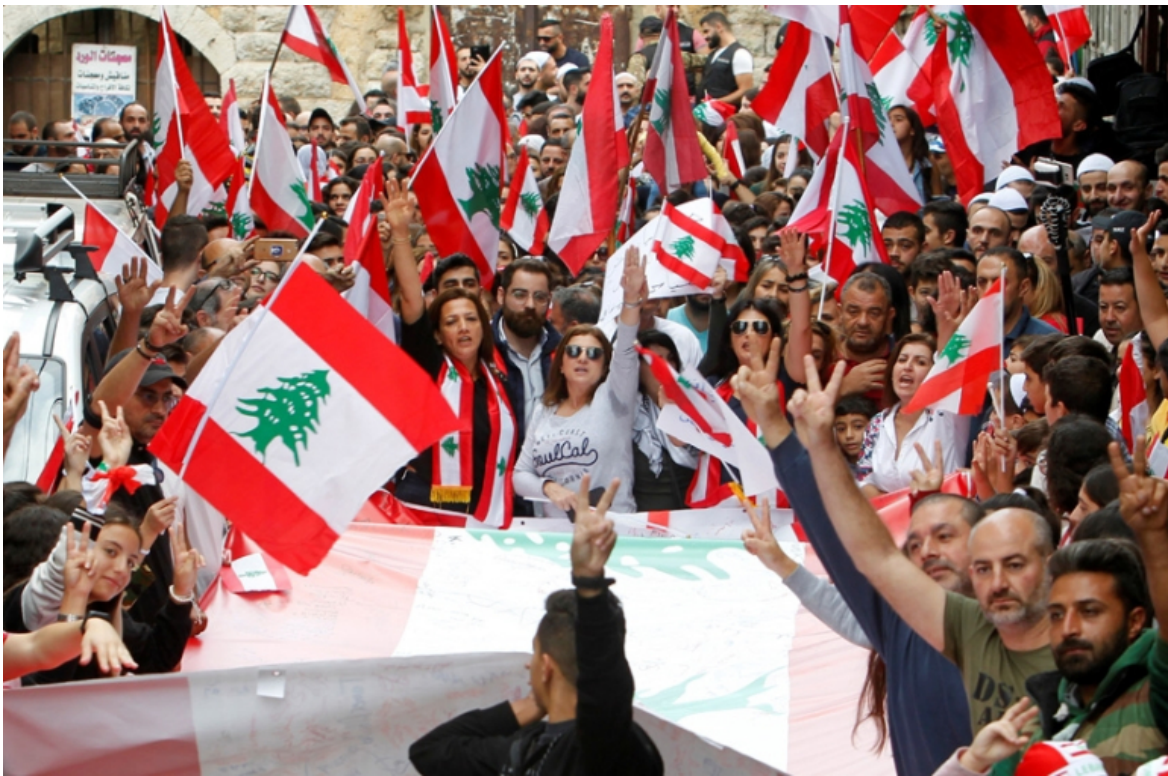
საპროტესტო აქცია დედაქალაქ ბეირუთში

2020-2021 წლებში საპროტესტო გამოსვლების ტალღებმაც გადაუარა ქვეყანას. ლიბანელები აპროტესტებენ გაუარესებულ სოციალურ მდგომარეობას, უმუშევრობას, მაღალ ინფლაციას, კორუფციას და ა.შ.