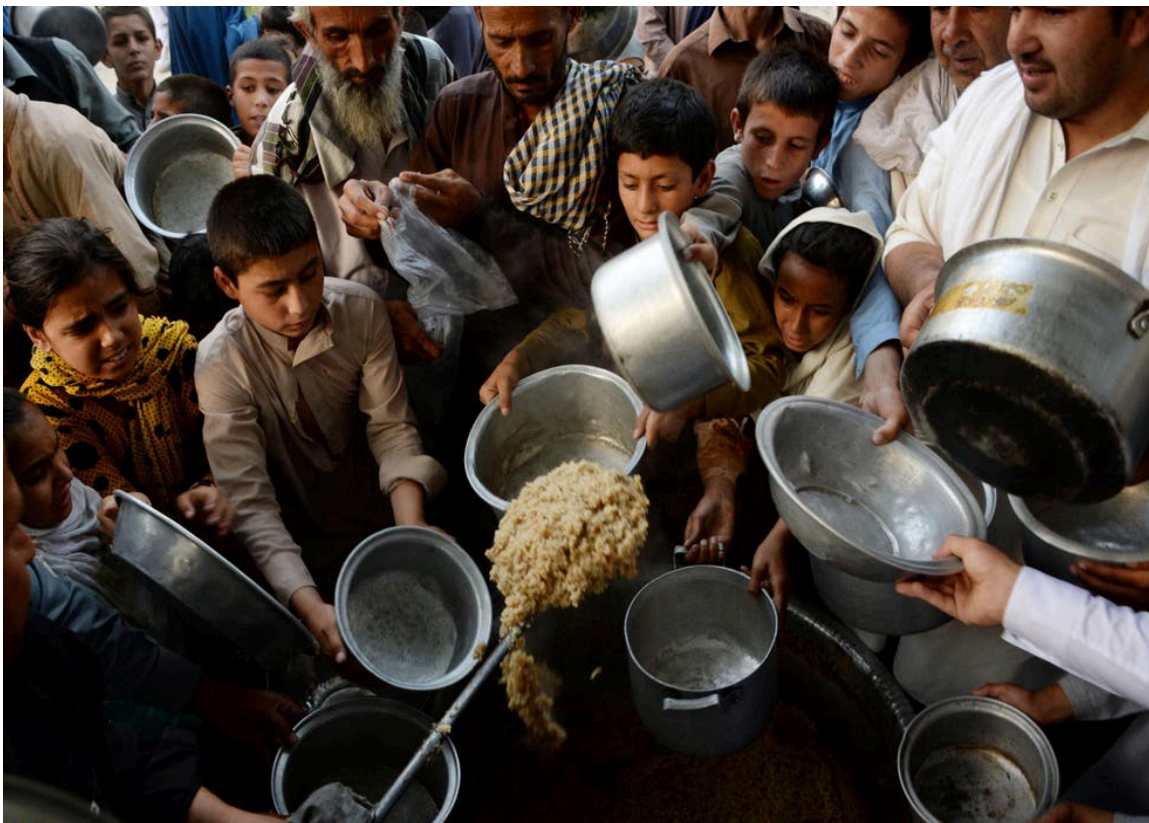
დახმარების მომლოდინე ავღანელები

მაგრამ „თალიბანის“ ხელისუფლებაში მოსვლის შემდეგ შეწყდა უცხოური დახმარებები, რაც ქვეყნის GDP-ის (მთლიანი შიდა პროდუქტი) 40%-ს შეადგენდა.