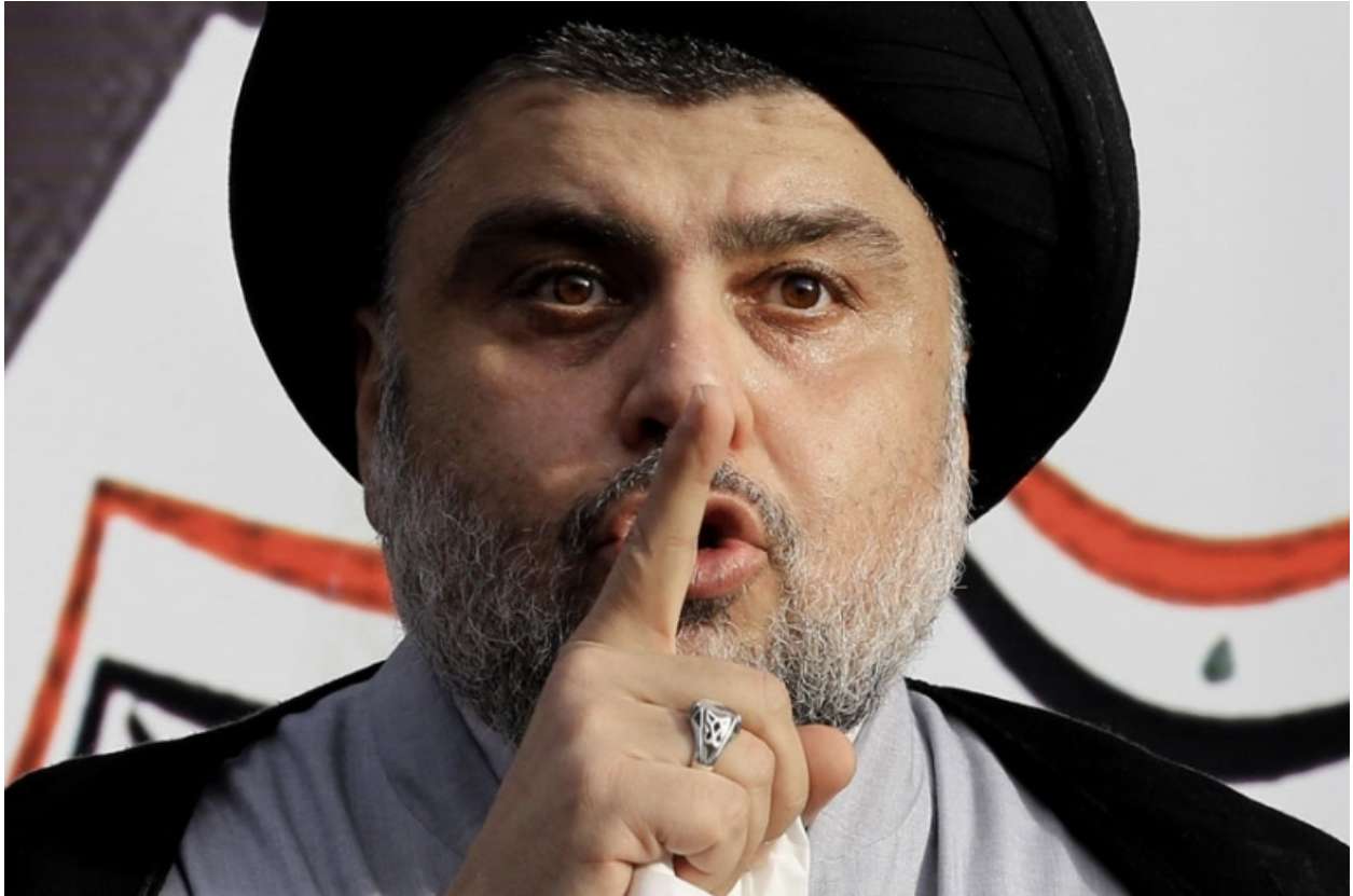
შიიტი რელიგიური ლიდერი მუქთადა ალ-სადრი

ასეთი დაქსაქსული პოლიტიკური სურათის გამო შესაძლოა ახალი კოალიციური მთავრობა მალე ვერ ჩამოყალიბდეს. მის შექმნაზე მოლაპარაკებები ჯერ არც დაწყებულა, თუმცა არჩევნების შედეგებიდან გამომდინარე ვარაუდობენ, რომ გადამწყვეტი იქნება მუქთადა ალ-სადრის პოზიციები.