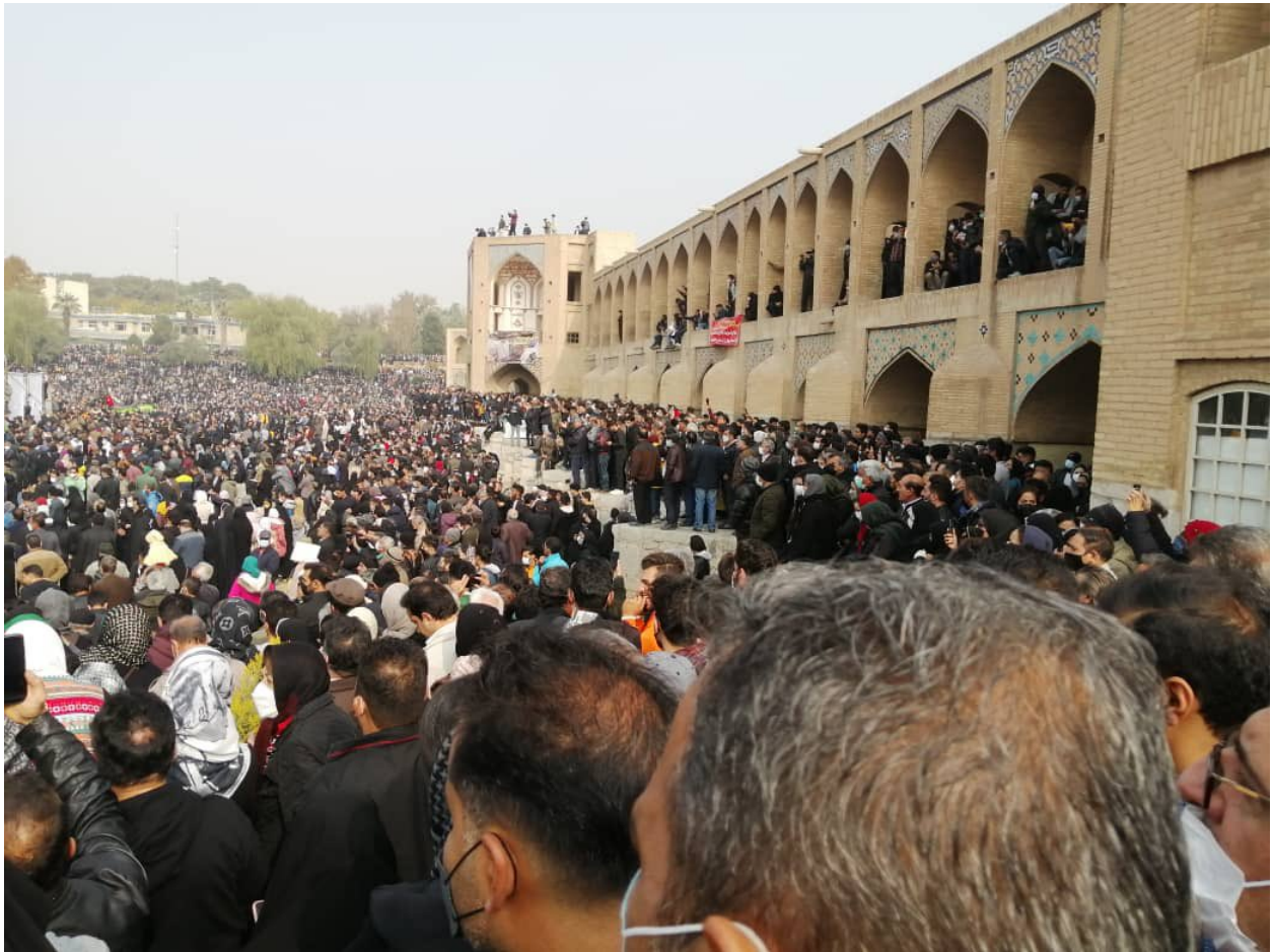
19 ნოემბერს ქ. ისფაჰანში დამშრალი მდინარე ზაიანდერუნის კალაპოტში გამართული საპროტესტო აქცია

რას აპროტესტებენ ირანის მოქალაქეები და რა მოთხოვნები აქვთ მათ?