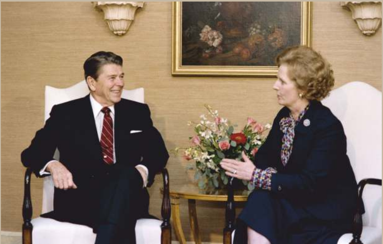
რონალდ რეიგანი და მარგარეტ ტეტჩერი, 1979

მსოფლიოს ასევე გაუმართლა, რომ გლობალური კომუნიზმის წინააღმდეგ მებრძოლ ორ ბუმბერაზ ფიგურას – რონალდ რეიგანს და მარგარეტ ტეტჩერს – ერთდროულად მოუწიათ მოღვაწეობა, რამაც ისინი უახლოეს თანამებრძოლებად და მეგობრებად აქცია. ტრანსატლანტიკური კავშირი და აშშ-ბრიტანეთის „განსაკუთრებული ურთიერთობები“ არასდროს ყოფილა ისეთი მყარი, როგორც იყო რეიგან-ტეტჩერის პარტნიორობის პერიოდში.