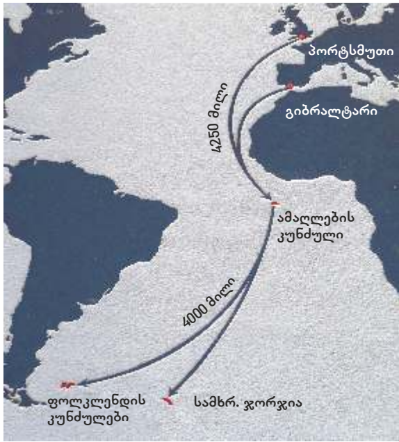
ბრიტანული ოპერატიული დაჯგუფების თავდასხმა ფოლკლენდის კუნძულებსა და სამხრეთ ჯორჯიაზე, 1841

სწორედ ამ დროს, 1841 წელს, ბრიტანეთი და პირადად ტეტჩერი ახალი გამოწვევის წინაშე აღმოჩნდნენ. არგენტინის სამხედრო დიქტატორმა, გენერალმა გალტიერომ ბრიტანული კოლონიის – ფოლკლენდის და სამხრეთ ჯორჯიის კუნძულების ოკუპაცია მოახდინა. ამ კუნძულებზე პრეტენზიას არგენტინა მრავალი წლის