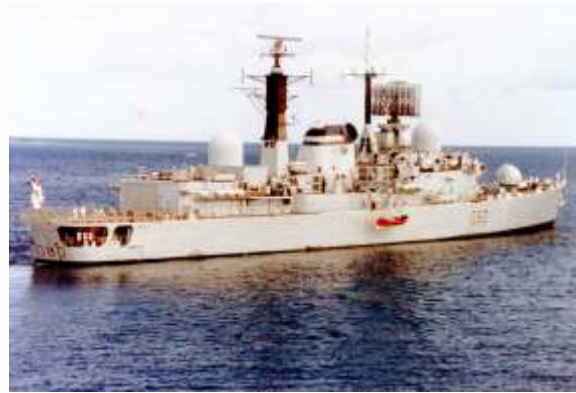
ბრიტანეთის სამეფოს სამხედრო-საზღვაო ფლოტის ხომალდი HMS Sheffield, 1982

სწორედ ამ დროს, 1841 წელს, ბრიტანეთი და პირადად ტეტჩერი ახალი გამოწვევის წინაშე აღმოჩნდნენ. არგენტინის სამხედრო დიქტატორმა, გენერალმა გალტიერომ ბრიტანული კოლონიის – ფოლკლენდის და სამხრეთ ჯორჯიის კუნძულების ოკუპაცია მოახდინა. ამ კუნძულებზე პრეტენზიას არგენტინა მრავალი წლის