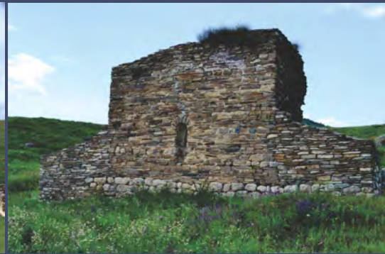
ალზი-ერდის ტაძარი ინგუშეთში

ურ მასალაში ნაპოვნია ქართული ანბანის გამოყენებით შესრულებული ხუნძური წარწერები.