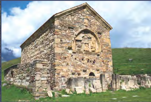
ტყოზა-ერდის ტაძარი ინგუშეთში