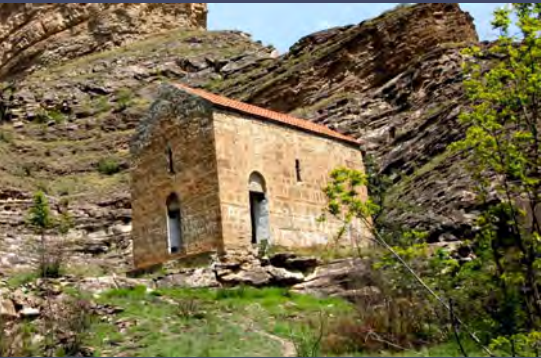
დათუნას ეკლესია დალესტანში