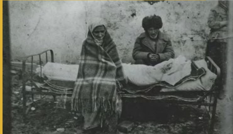
ინგუშების ოჯახი ყაზახეთში, კალინინის ცხენდართან

კავკასიელ ხალხთა დეპორტაცია – მეორე მსოფლიო ომის დროს იოსებ სტალინი და საბჭოთა ხელმძღვანელობა ზოგ ჩრდილოკავკასიელ ხალხს არასანდოდ მიიჩნევდა. მათი აზრით არსებობდა რისკი, რომ ისინი ფაშისტური გერმანიის მხარეზე გადავიდოდნენ. რისკის თავიდან აცილების გზად ამ ხალხების ციმბირსა და შუა აზიაში დეპორტაცია მიიჩნის. საბჭოთა ხელისუფლებამ გაასახლა ყარაჩაელები (1943), ჩეჩნები, ინგუშები და ბალყარელები (1944). სტალინის გარდაცვალების შემდეგ ამ ხალხების დიდი ნაწილი სამშობლოში დაბრუნდა.