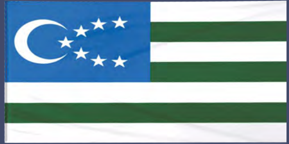
ჩრდილოეთ კავკასიის მთიელთა რესპუბლიკის დროშა

ჩრდილოეთ კავკასიის მთიელთა რესპუბლიკა – სახელმწიფო ჩრდილოეთ კავკასიაში, რომელიც შეიქმნა 1917 წელს რუსეთის ოქტომბრის რევოლუციის შემდეგ. მის შემადგენლობაში შედიოდა დღევანდელი ჩრდილოეთ კავკასიის უდიდესი ნაწილი. ამ სახელმწიფოს დამოუკიდებლობა აღიარა თურქეთმა, გერმანიამ, საქართველომ, აზერბაიჯანმა, ბულგარეთმა, დიდმა ბრიტანეთმა, ავსტრია-უნგრეთმა და ყუბანის რესპუბლიკამ. ჩრდილოეთ კავკასიის მთიელთა რესპუბლიკამ არსებობა 1920 წელს, საბჭოთა ოკუპაციის შემდეგ, შეწყვიტა.