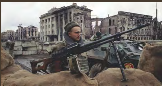
რუსი სამხედრო დანგრეული გროზნოს ფონზე, 1999

ქართველთა და ჩრდილოკავკასიელთა ნათესაობა სხვადასხვა ნიშნით დასტურდება. ენობრივი თვალსაზრისით, ქართველური და ჩრდილოკავკასიური ენები (გარდა ოსურისა) ერთიან იბერიულ-კავკასიურ ენათა ოჯახს ქმნიან. ამ ნათესაობის დასასაბუთებლად ენათმეცნიერებს, გარდა საერთო ფონეტიკური და გრამატიკული მახასიათებლებისა, მოჰყავთ იბერიულ-კავკასიურ ენათა ძირითად ლექსიკაში დადასტურებული ისეთი საერთო კუთვნილების სიტყვები, რომელთა საერთო ძირები საკუთრივ იბერიულ-კავკასიური ფუძე-ენიდან მომდინარე ჩანს, მაგ.: ქართული „გული“ და ჩერქეზული „გუ“, ჩეჩნური „დუოგ“; ქართული „ათი“ და ჩეჩნური „ითი“; ქართული „სული“ და ჩეჩნური „სა“, ჩერქეზული „ფსე“ და ასე შემდეგ.