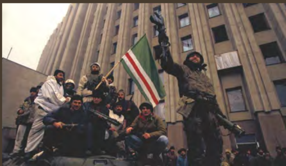
ჩეჩენი მებრძოლები აღნიშნავენ გამარჯვებას

რუსეთ-ჩეჩნეთის ომი დაიწყო 1994 წელს, როდესაც რუსეთის არმიამ ჩეჩნეთის რესპუბლიკაზე კონტროლის დამყარება სცადა. პირველი ომი 1996 წელს ჩეჩენი ხალხის გამარჯვებით დასრულდა, რის შედეგადაც რუსულმა საჯარისო დანაყოფებმა დატოვეს რესპუბლიკა. ჩეჩნეთის მეორე ომი დაიწყო 1999 წელს. მიუხედავად დიდი წინააღმდეგობისა, ვლადიმერ პუტინმა შეძლო ჩეჩნეთზე კონტროლის დამყარება. რუსეთის ქმედების შედეგად რამდენიმე ათეული ათასი მშვიდობიანი მოსახლე დაიღუპა, ხოლო ჩეჩნეთის დედაქალაქი გროზნი კი მიწასთან გასწორდა.