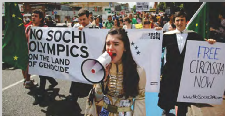
ჩერქეზების აქცია სოჭის ოლიმპიადის წინააღმდეგ

რუსეთის იმპერიის შემოსვლამდე ჩერქეზები რაოდენობრივად კავკასიის ყველაზე დიდ ერს წარმოადგენდნენ. თუმცა, რუსეთის იმპერიული პოლიტიკა ითვალისწინებდა ჩრდილო-დასავლეთ კავკასიის მისი მკვიდრებისგან განმედასა და მათ ადგილზე მორჩილი ხალხების დასახლებას. ამ მიზნით, XIX საუკუნეში დაიწყო ჩერქეზი ერის მიზანმიმართული განადგურება ან გასახლება ოსმალეთის იმპერიაში. ამ მოვლენების პიკი იყო 1864 წლის 21 მაისი, როდესაც სოჭის მახლობლად სოფელ ქბაადეში (ამჟამინდელი კრასნაია პოლიანა) გაიმართა უკანასკნელი ბრძოლა ჩერქეზებსა და რუსებს შორის. ბრძოლის შემდეგ მთელი ჩერქეზეთის მასშტაბით მოეწყო სასაკლაო. გენოციდის შედეგად ჩერქეზთა 90 პროცენტი ან ფიზიკურად განადგურდა, ან გაასახლეს ოსმალეთის იმპერიაში. აღსანიშნავია, რომ თითქმის 150 წლის შემდეგ რუსეთმა სწორედ კრასნაია პოლიანაში, ჩერქეზთა ყლექტის ადგილას, ჩაატარა სოჭის ზამთრის ოლიმპიური თამაშები.