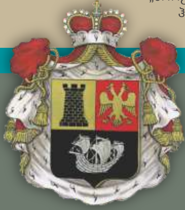
ანდრონიკაშვილების საგვარეულო გერბი

ქართული ჯარი ორ ნაწილად გაიყო – ერთი ნაწილი შავი ზღვის სანაპიროს გაუყვა, მეორე ნაწილი კი გემებზე ავიდა და ზღვიდან ამაგრებდა ხმელეთზე მოძრავ ლაშქარს.