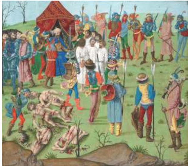
სელჩუკთა მიერ ლათინი ტყვეების დასჯა

ტერიტორიულ დანაკარგებს ერთი დადებითი შედეგი ჰქონდა ახალგაზრდა სახელმწიფოსთვის – ტრაპიზონის იმპერია უშუალოდ აღარ ემეზობლებოდა მოქიშპე ნიკეას, თანაც გეოგრაფიულად შედარებით იზოლირებულ და, შესაბამისად, უფრო უსაფრთხო სივრცეში მოექცა. სამხრეთით მას ბუნებრივად იცავდა მაღალი მთების სისტემები, ჩრდილოეთით – შავი ზღვა, აღმოსავლეთით – მოკავშირე საქართველო, ხო-