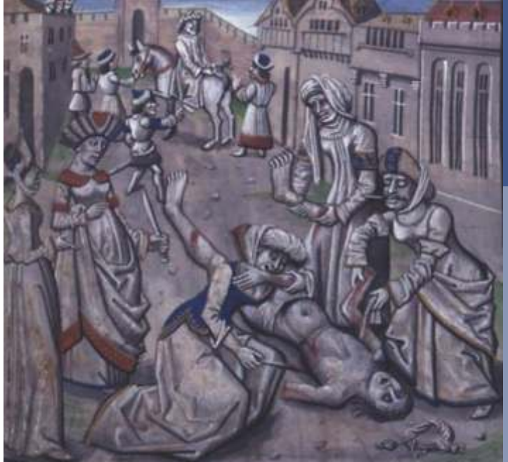
იმპერატორ ანდრონიკი I კომნენოსის მკვლელობა კონსტანტინოპოლში

თამარ მეფის ფრესკა ვარკიიდან, XII საუკუნე