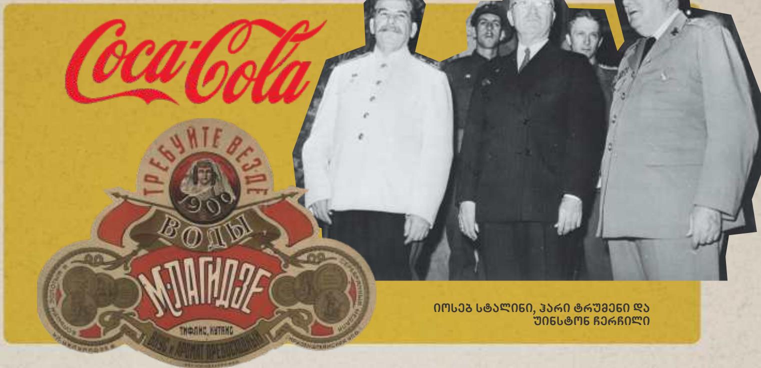
იოსებ სტალინი, ჰარი ტრუმენი და უინსტონ ჩერჩილი