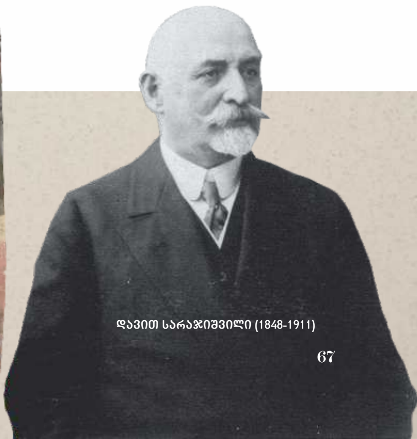
დავით სარაჯიშვილი (1848-1911)