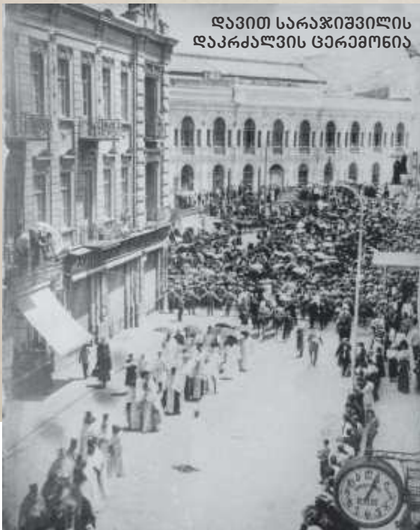
დავით სარაჯიშვილის დაკრძალვის ცერემონია

მიტროფანე ლალიძის წარმოებული სასმელები საყოველთაო მოწონებას იმსახურებდა, მოსწონდათ და უყვარდათ მთელ საბჭოთა კავშირში, მიტროფანეს კი იწვევდნენ სხვადასხვა რესპუბლიკაში და იქ წარმოების დაარსებას სთხოვდნენ.