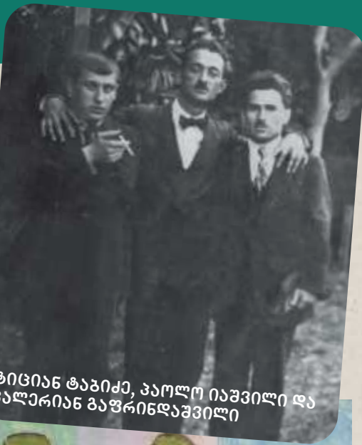
ტიციან ტაბიძე, პაოლო იაშვილი და ვალერიან გაფრინდაშვილი